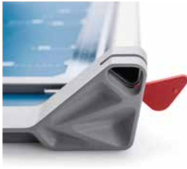
Dahle Rollenschneider 508 (Generation 3) - einfacher Messerkopf-Tausch mit unverlierbarer Verriegelung