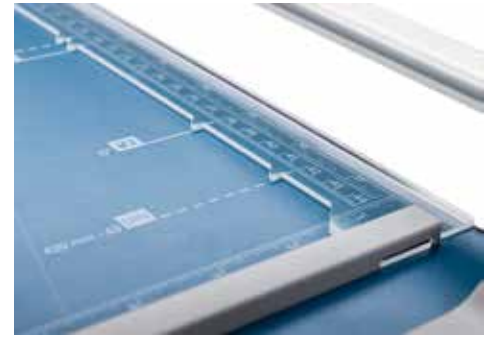
Dahle Rollenschneider 508 (Generation 3) - nützliche Formatlinien und die Pressschiene mit Markierungshilfen erleichtern das Ausrichten des Schnittgutes