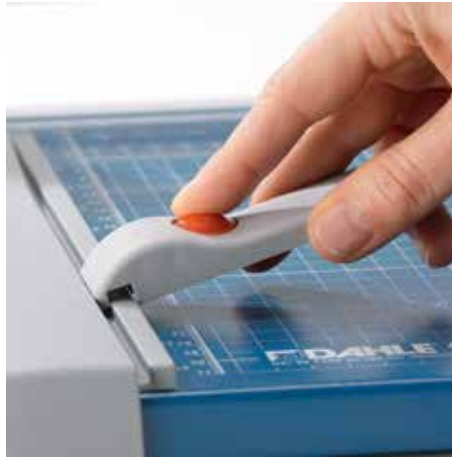
Verstellbarer Rückanschlag zur schnellen Formatfindung - auf beiden Winkelanlagen einsetzbar