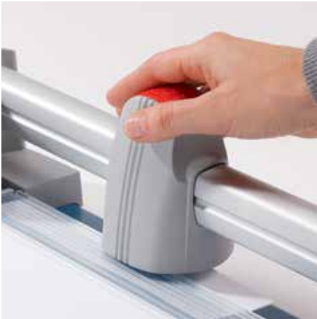
Ergonomischer Schneidekopf für eine komfortable Bedienung der Schneidemaschine