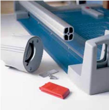
Einfacher Messerkopfwechsel sorgt für reibungslose Arbeitsabläufe